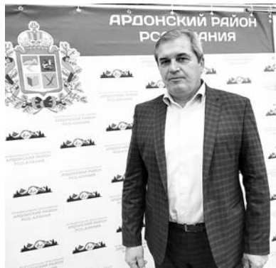
пенсионеров в общественной жизни района".